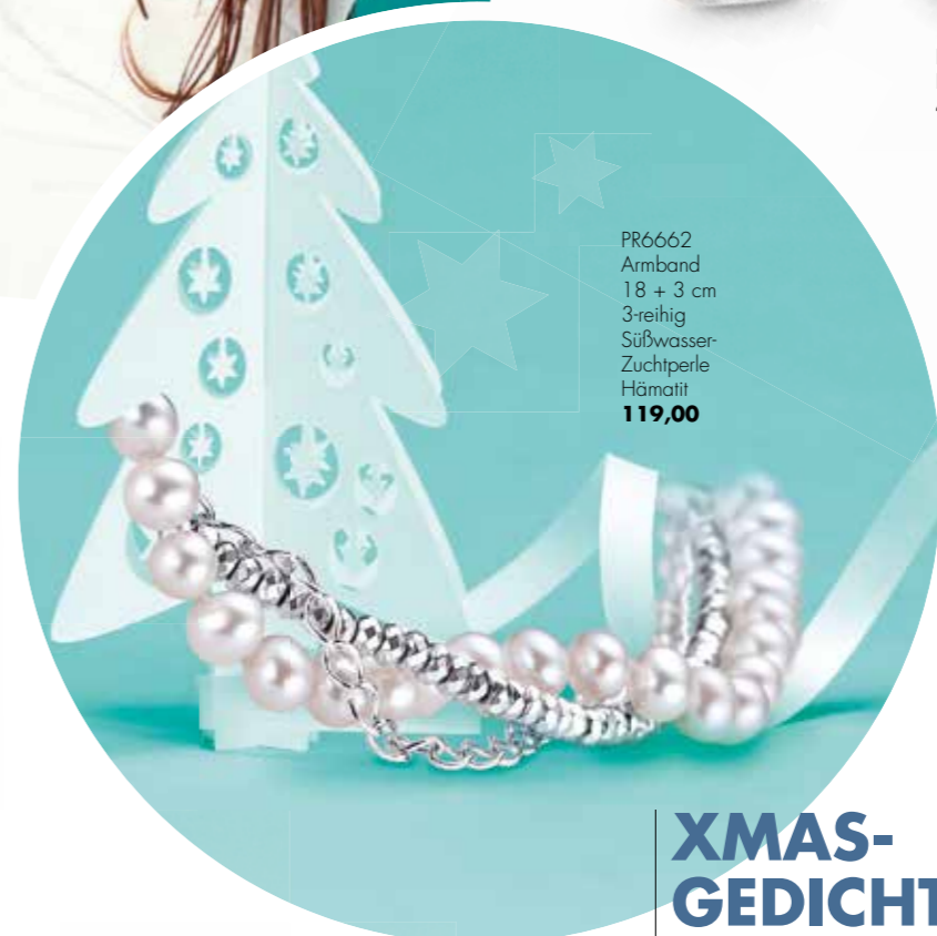
PR6662 Armband 18 + 3 cm 3-reihig Süßwasser-Zuchtperle Hämatit 119,00