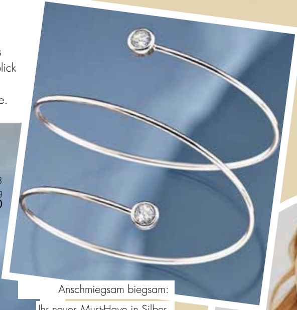
Anschmiegsam biegsam: Ihr neues Must-Have in Silber.