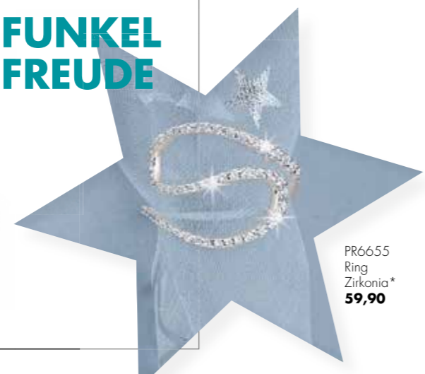
PR6655 Ring Zirkonia* 59,90

Ich wünsch' mir was: Die neuen Highlights aus Silber.