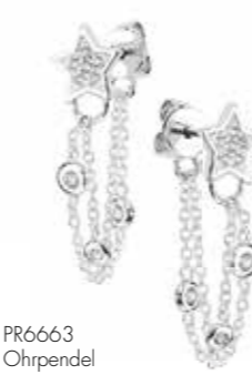
PR6663 Ohrpendel 69,90