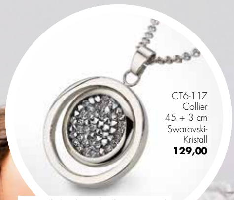
CT6-117 Collier 45 + 3 cm Swarovski- Kristall 129,00

Federleicht und allergieneutral Wellnesszone of fashion