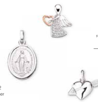
PR6671 Anhängler rosé-vergoldet 36,00