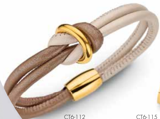
CT6-112 Armband, 19 cm Magnet-Schließe 89,90

Federleicht und allergieneutral Wellnesszone of fashion