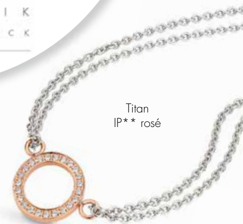
Titan IP** rosé