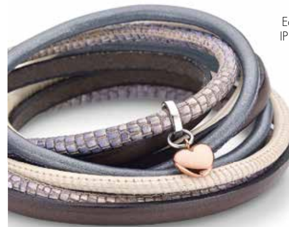
Edelstahl IP** rosé

*Zirkonia ist ein synthetisches Produkt. **IP = ionenplattiert