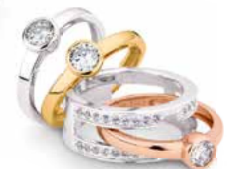
PR6601 Ring 4-teilig Zirkonia* 199,00