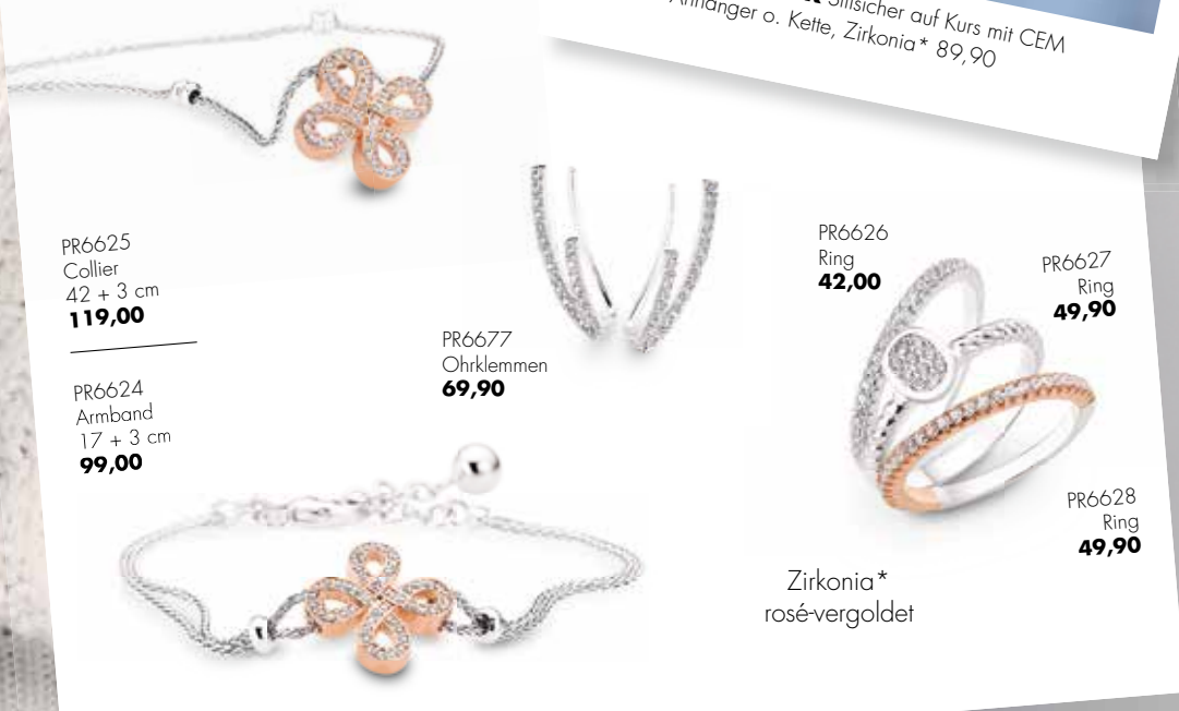
PR6625 Collier 42 + 3 cm 119,00