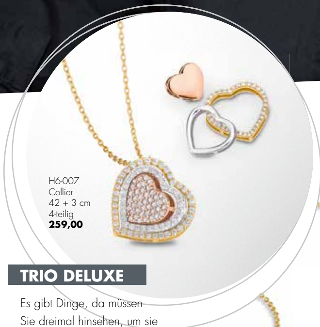
H6-007 Collier 42 + 3 cm 4-teilig 259,00

Der Fashion-Zirkus ist bunt, schrill und vor allen Dingen laut. Hip und trendy drängt sich jeder in den Vordergrund, um den Catwalk für sich zu gewinnen. Ganz anders präsentiert sich Gold. Ein wahrer Star der Mode, der souverän den Logenplatz für sich behauptet. Nehmen Sie Platz und genießen Sie seine Gegenwart – CEM lädt zur Premiere.