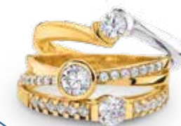
H6-018 Ring, Zirkonia* 189,00