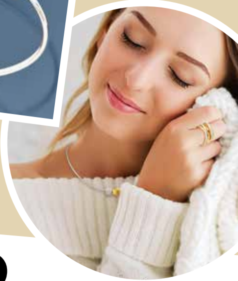
PR6637 Armspange Zirkonia* 79,90