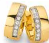
CT6-115 Scharnier- creolen 79,90