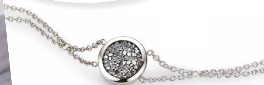
CT6-116 Armband 19 + 2 cm Swarovski-Kristall 99,00