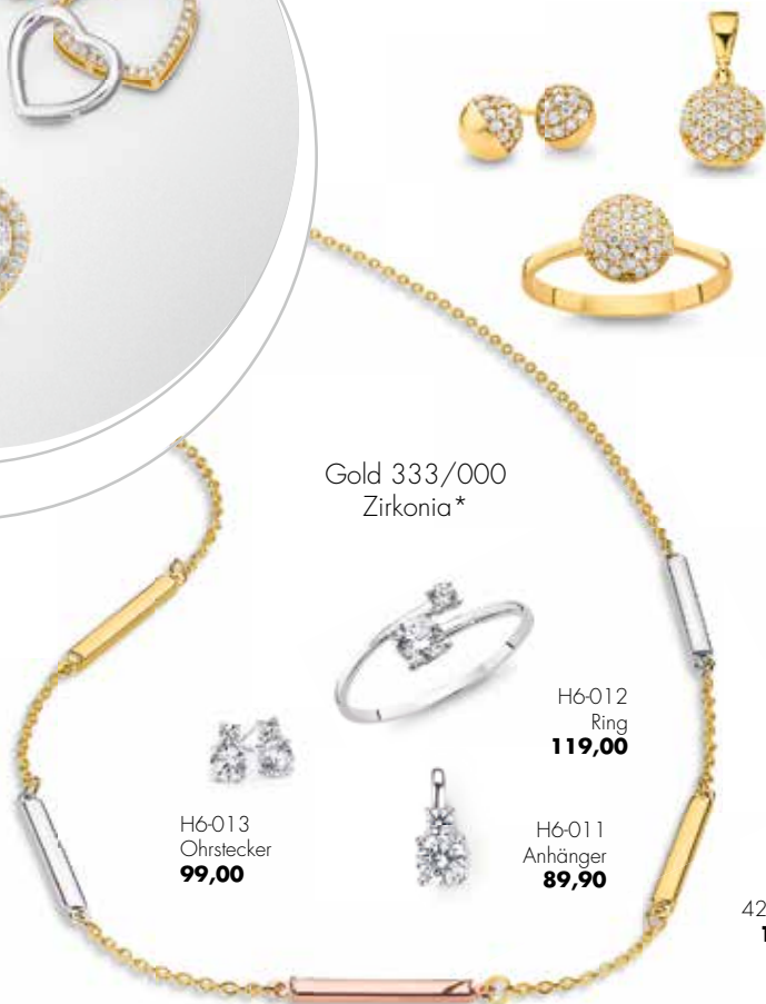
H6-013 Ohrstecker 99,00

Es gibt Dinge, da müssen Sie dreimal hinsehen, um sie zu glauben. Gerne doch. Seien Sie ruhig schaulustig, denn gerade dafür sind sie gemacht: ob einzeln, als Duo oder Trio, als Mix aus Vorder- und Rückseiten. Der neue Herzenhänger von CEM.