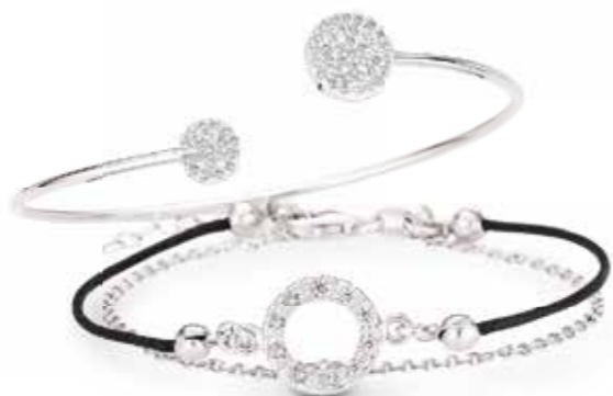
PR6656 Armspange Zirkonia* 59,90