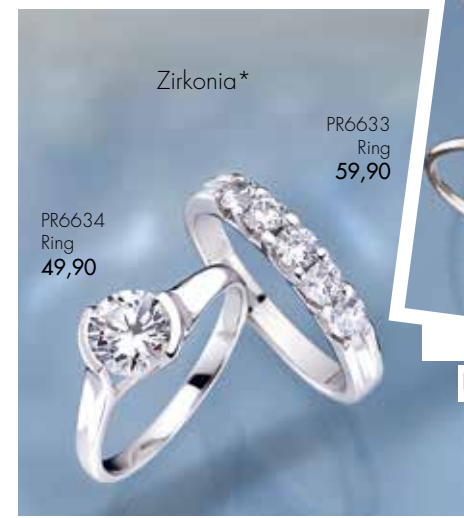
PR6634 Ring 49,90

MOMENTAUFNAHMEN geben uns häufiger als gedacht einen kleinen Einblick in aufsehenerregende Ereignisse. Dann schauen Sie hin, CEM hat einige für Sie.