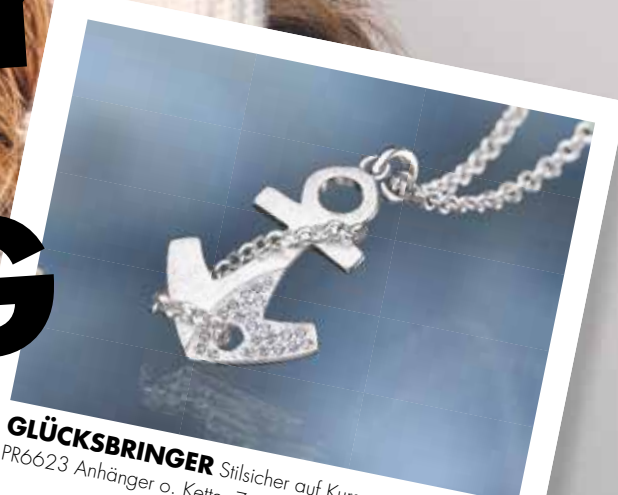
GLÜCKSBINGER Silsicher auf Kurs mit CEM PR6623 Anhänger o. Kette, Zirkonia* 89,90