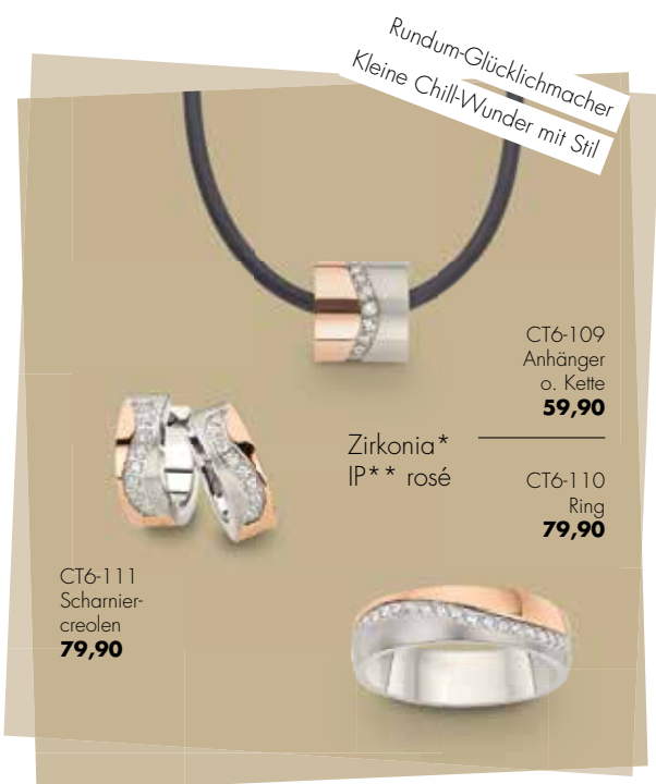
Zirkonia* IP** rosé