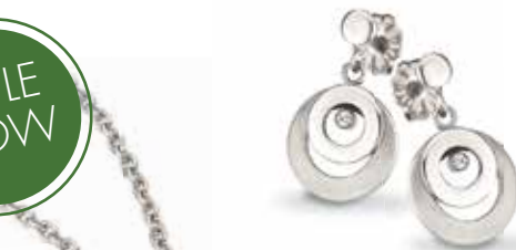
CT6-118 Collier 42 + 3 cm 96,00