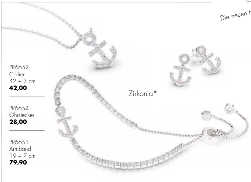
PR6652 Collier 42 + 3 cm 42,00

Upps! Bevor Sie nun ins Grübeln kommen und Zeit mit langem Nachdenken verschwenden, konzentrieren Sie sich lieber auf den Gabentisch. Denn wir wissen: Ein bisschen „frech“ kann doch äußerst sexy sein.