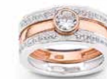
Silber 925/000 rhodiniert vergoldet/ rosé-vergoldet