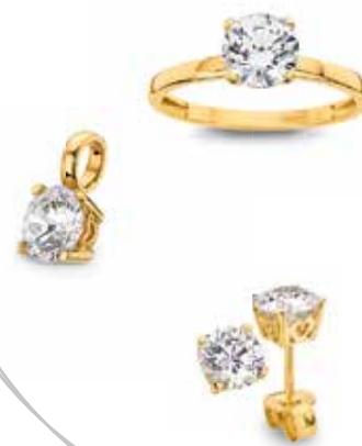
H6-022 Ring 189,00